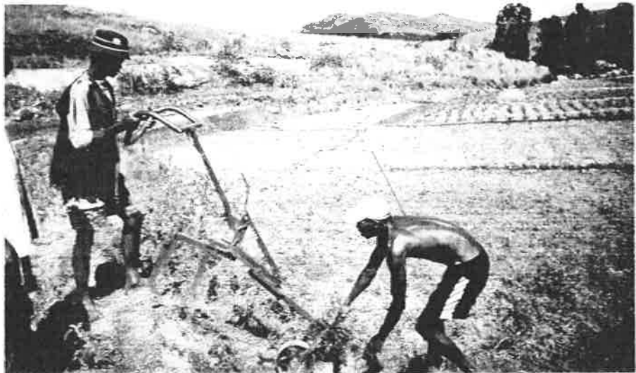
Descente dans la rizière

Le village n'a pas l'électricité, aucun engin à moteur n'y monte, les toits de chaume n'ont aucune antenne :