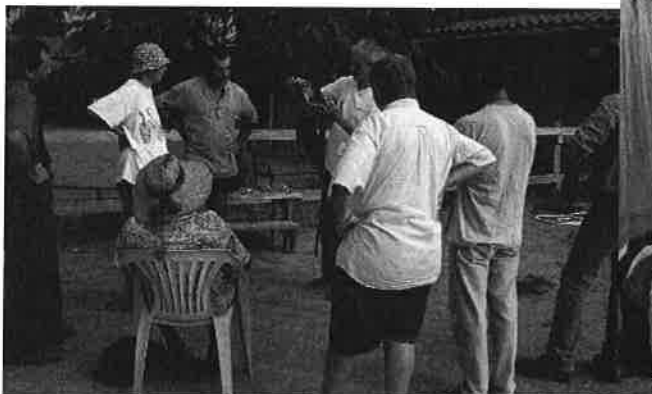
des journées techniques, des formations et...