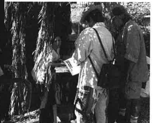
...des foires !!