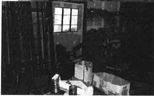
Aménagement de l'atelier recherche...