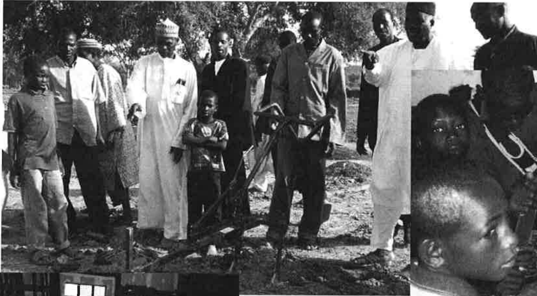
Une première action au Niger