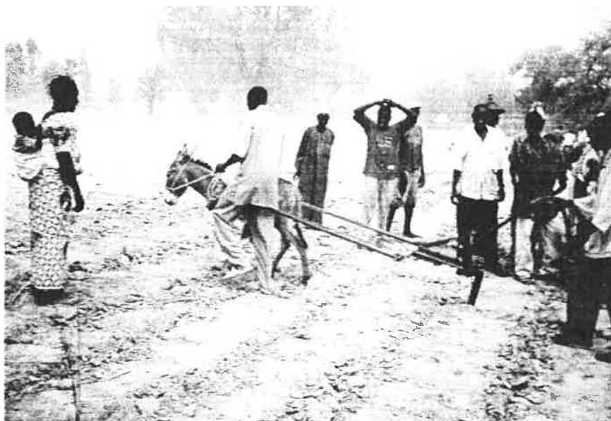
L'âne et le Kanol

paysans, les représentants des administrations et des techniciens attachés au ministère de l'industrie et de la recherche, le syndicat des éleveurs, de nombreux nouveaux paysans et des représentants d'ONG venus pour l'occasion découvrir notre travail.